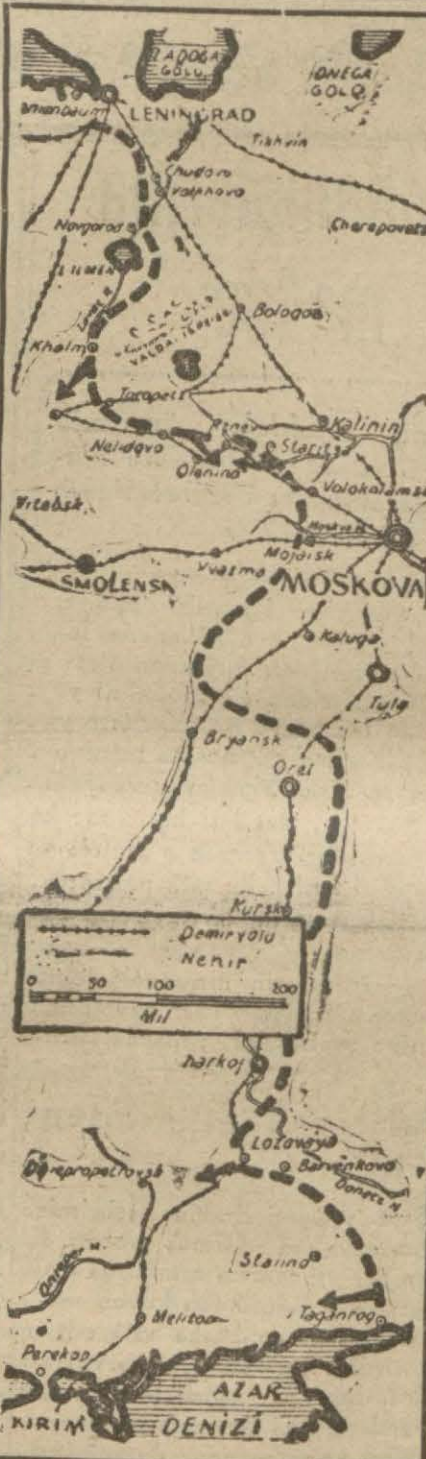
Bir İngiliz muavazinesi göre şark cephesinin bugünkü vaziyetini gösterir kroki

Berlin 10 (A.A.) — Alman ordularının başkomutanlığının tebliği: Şark cephesinde düşman dün de hiçbir muvaffakiyet elde edemedi. Taarruzlarına devam etmiştir. Merkez kesiminde orduya mensub teşküller ve hücum kütahaları bir kaç hat üzerinde kademelenmiş olan mevzileri düşmanın anudane mukavemetine rağmen yarımlardır. Sov (Devamı 5'inci sayfada)