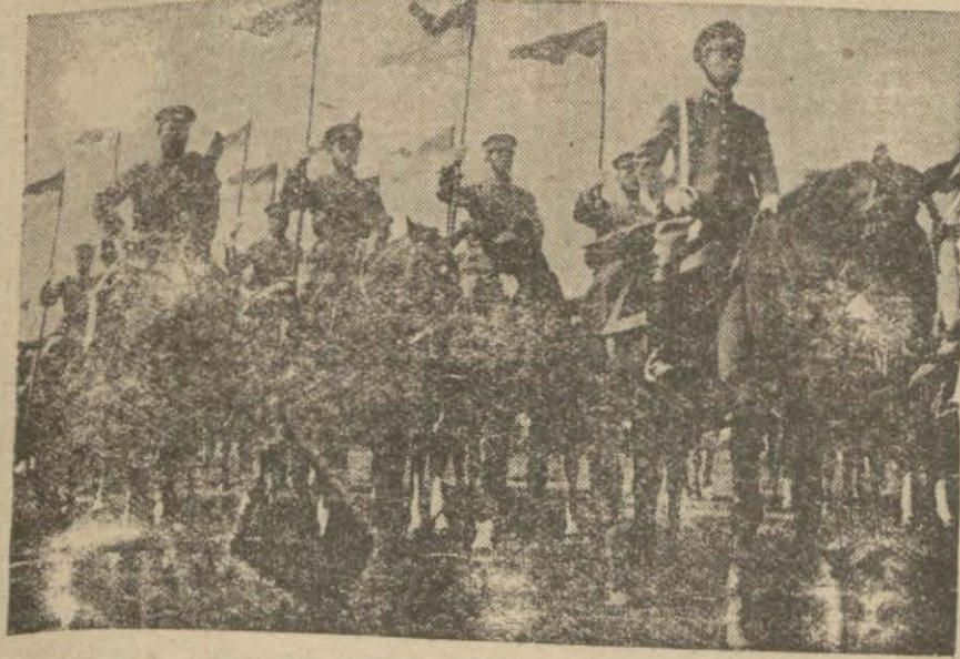
Bir Japon süvari müfrezesi harekete hazırlanırken

Ankara, 10 (T. E.) — Zirai seferberliğe ilerisi için bol miktarda istihlal hazırlıkları yapılırken, diğer taraftan da hükümet, stok temin etmek üzere muhtelif memleketlerden buğday getirtmektedir. Son günler zarfında memleketlere yeniden 20 bin ton buğday ithal edilmiştir. Bu 20 bin tonla ithal edilen buğday miktarı 70 bin tonu bulmaktadır. Bu miktar 150 bin tona çıkarılacaktır. İthalat biter bitmez, azaltılmak üzere ekmek miktarı bir miktar yükseltilecektir.